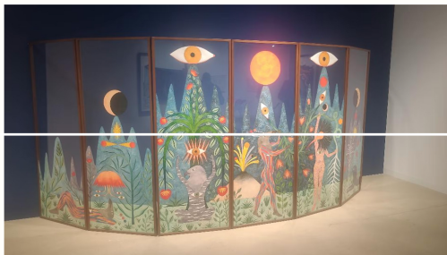
Paravent de Rithika Merchant sur le stand de la galerie Tarq.

« Pour 1 million de dollars, on n'est pas toujours sûr d'avoir la qualité en art contemporain, tandis qu'en art moderne, on peut s'offrir un chef-d'œuvre doté d'un pedigree formidable d'expositions en musées ! Et non pas juste un artiste dont d'autres œuvres se trouvent dans le stockage d'un collectionneur », observe le conseiller Didier Chaillou. « J'étais désolé de voir le moderne perdre des points face au contemporain. C'est en train maintenant de s'équilibrer alors que le marché du contemporain est plus compliqué et qu'il faut se rabattre vers des valeurs sûres », estime-t-il. Les valeurs sûres sont justement en abondance cette année à Art Basel. Hauser & Wirth se félicite d'avoir vendu 35 œuvres dont un Picasso dont le prix demandé était de 35 millions de dollars, ainsi qu'un Fontana à 5,5 millions de dollars. Thaddaeus Ropac montre un Baselitz à 1,9 million d'euros et une peinture de la Statue de la Liberté par Warhol imitant le camouflage militaire, à 5,5 millions de dollars. Mais aussi, comme à Unlimited, le travail d'Oskar Schlemmer des années 1930 ! Pace présente un immense relief mural de Jean Dubuffet à 2,8 millions de dollars et la dernière sculpture d'Alexander Calder datant de 1976, pour « un prix à 8 chiffres ». Acquavella, de son côté, propose un nu masculin tardif de Lucian Freud pour environ 80 millions de dollars, ainsi qu'un autoportrait ébouriffé d'Andy Warhol affiché à « plus de 30 millions de dollars ».