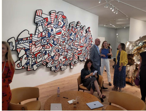
Vue du stand de la galerie Pacesur Art Basel 2026

C'est sous des auspices plutôt encourageants que s'est ouverte ce 16 juin 2026 la foire Art Basel, alors qu'était annoncé un accord – encore fragile – entre les États-Unis et l'Iran offrant la perspective d'une réouverture imminente du détroit d'Ormuz. Cette nouvelle a été accueillie favorablement par la bourse de New York. Longtemps l'une des principales clés du succès d'Art Basel, les Américains n'ont pas totalement déserté les allées de la foire. D'autant que la Biennale de Venise peut cette année contribuer à les attirer en Europe. Au-delà de leurs conseillers, certains collectionneurs étaient bien présents, sans compter des responsables de musées de premier plan. « Nous avons vendu notamment à une collectionneuse que nous avons rencontrée au MoMA de New York, et vu les directeurs du MoMA et du Met ainsi que leurs conservateurs », confie David Fleiss. La galerie parisienne qu'il dirige, 1900-2000, se distingue par une myriade de petits bijoux surréalistes à tous les prix, mais surtout par un focus consacré aux œuvres surréalistes tardives (des années 1970) d'Yves Laloy, défendu en son temps par André Breton (de 20 000 à 80 000 euros) et exposé il y a quelques années par la galerie Perrotin. L'enseigne a fait appel à la directrice artistique de la marque Pucci, Camille Miceli, pour relooker ce mini-stand avec une scénographie haute en couleurs. Malin pour faire le buzz.