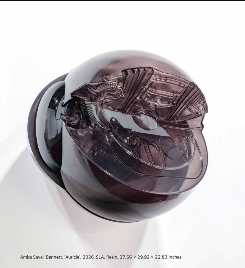
Amba Sayal-Bennett, 'Auricle', 2026, SLA, Resin, 27.56 x 29.92 x 22.83 inches.