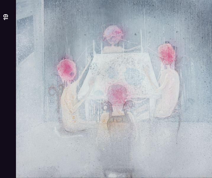
Brilant Milazimi, 'Who talks first?', 2025, Oil on canvas, 180 x 200 cm.