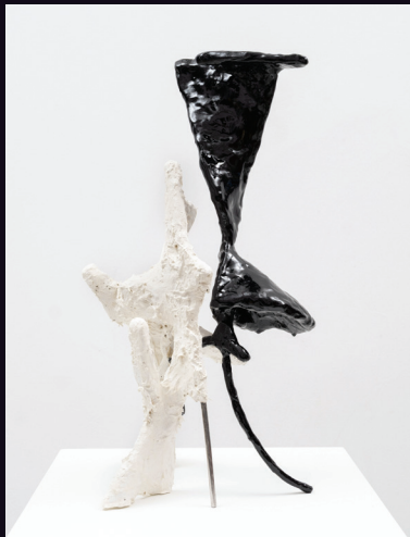
Nabilah Nordin, 'Two Bridges', 2026, Aluminium mesh, aqua resin, epoxy modelling compound, epoxy resin, glass fibre reinforcement, mulberry paper, PVA adhesive, welded mild steel, welded stainless steel, lime paint, 53.3 x 24.1 x 27.9 cm.