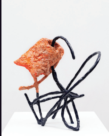
Nabilah Nordin, 'Script Site', 2026, Aluminium mesh, aqua resin, epoxy modelling compound, epoxy resin, fibre dyes, pigment powder, lime paint, welded mild steel, 37.8 x 36.2 x 16.5 cm.