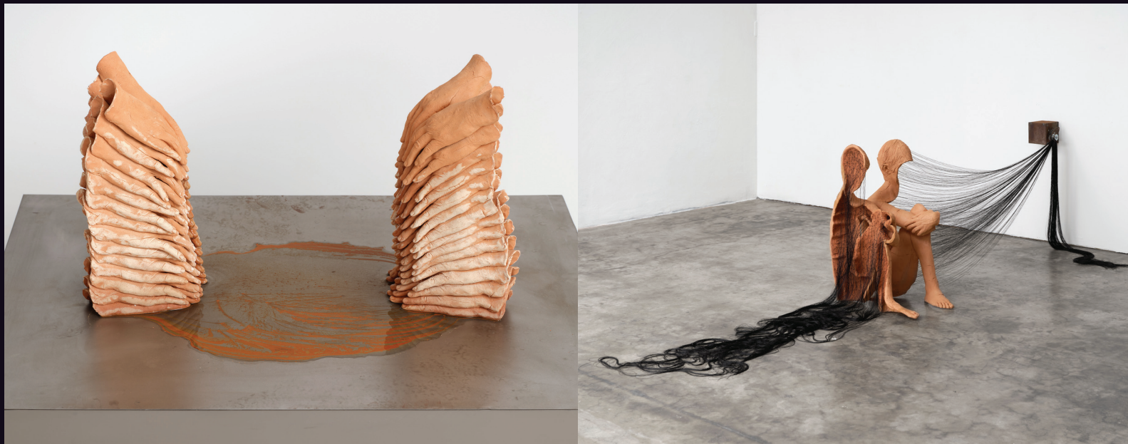
Roksana Pirouzmand, 'Mountains', 2025, Ceramic, steel, water, water pump, patina, 69 x 102 cm.

동시대 미술이란 결국 자기 자신에게 솔직해야 하는 거다. 그렇다면 작업이 만들어지는 맥락을 정확히 이해할 수 있다.