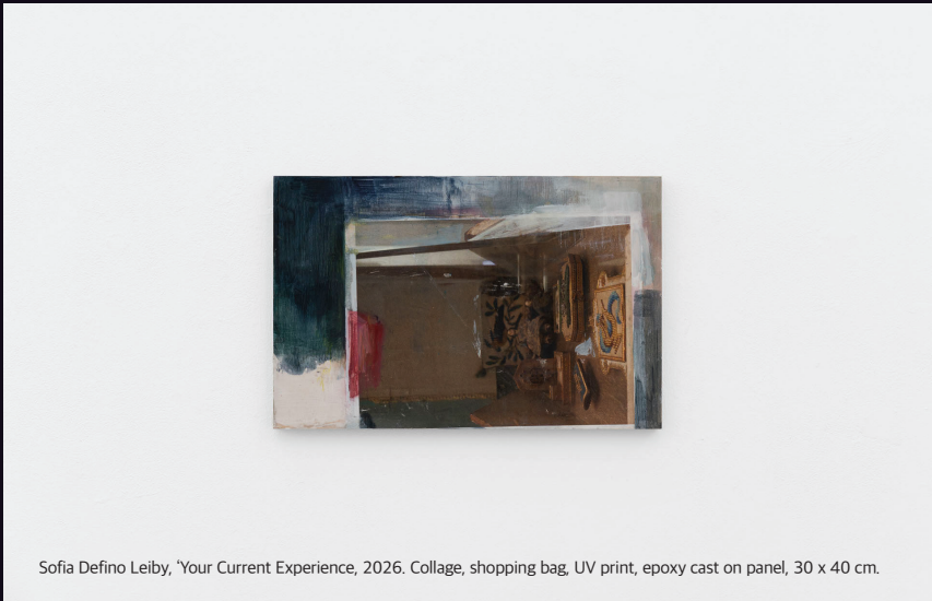
Sofia Defino Leiby, 'Your Current Experience', 2026. Collage, shopping bag, UV print, epoxy cast on panel, 30 x 40 cm.