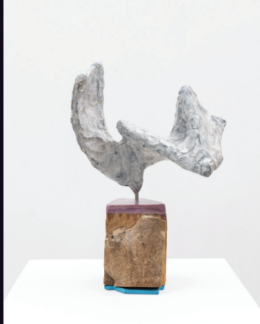
Nabilah Nordin, 'Modern Art', 2026, Acrylic paint, aluminium mesh, aqua resin, basswood, construction adhesive, epoxy modelling compound, epoxy resin, pigments, welded mild steel, wood, 40.0 x 26.7 x 16.8 cm.