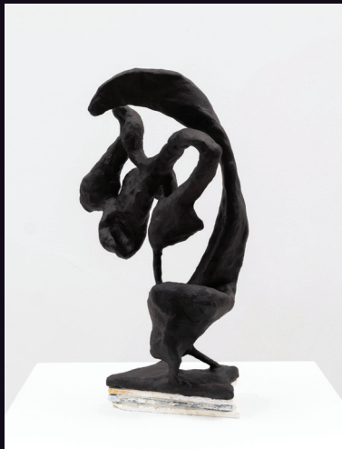
Nabilah Nordin, 'Michelin E-Smoke', 2026, Aluminium mesh, aqua resin, basswood, construction adhesive, epoxy modelling compound, spray paint, welded steel, white pigment, 41.0 x 27.6 x 26 cm.